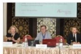
Atelier pour ministère commerce USA