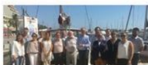
Formation nouveaux franchiseurs