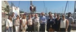
Formation nouveaux franchiseurs