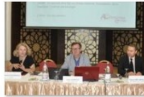
Atelier pour ministère commerce USA