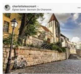
La balade instagrammable - Scr... scrunchie-is-back.com