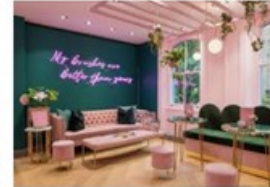
Les magasins doivent devenir Instagramm... pubosphere.fr