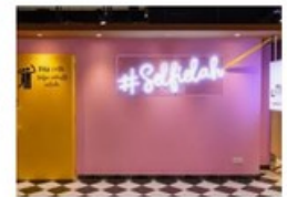
Lieux instagrammables : l'expérience p... brainstorming.fr