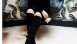
▷ 9 façons de rendre votre établis... webmarketing-com.com