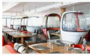
Instagrammable » : nouveau mot d'ordre de l'expé... lehub.laposte.fr