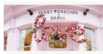
5 lieux Instagrammables à Londres - Le blog Dealeuse ... dealeusedevoyages.com