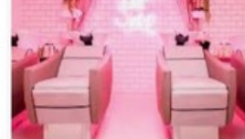
5 façons de rendre votre institut plu... treatwell.fr