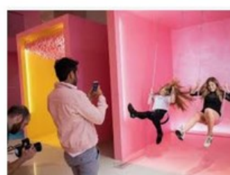
INSTA-STRATEGY : COMMENT LE RETAIL D... workshop.fr