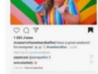
Lieux instagrammables : ... brainstorming.fr