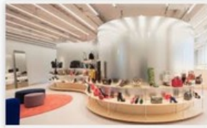
Le magasin instagrammable | Mieuxvendreblog.fr mieuxvendreblog.fr