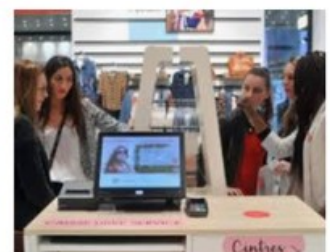
Le magasin instagrammable, nouveau le... cofidis-retail.fr