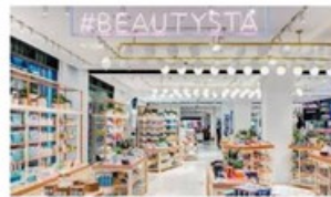
Serviciels, instagrammables, écolos... Quels mag... lehub.laposte.fr