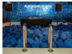
Krys ouvre son playground instagram... isa-conso.fr