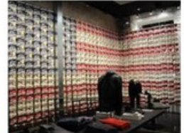
Le magasin instagrammable : la prome... sqi-digital-experience.com