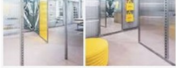
Le concept store très instagrammable imaginé ... pinterest.com